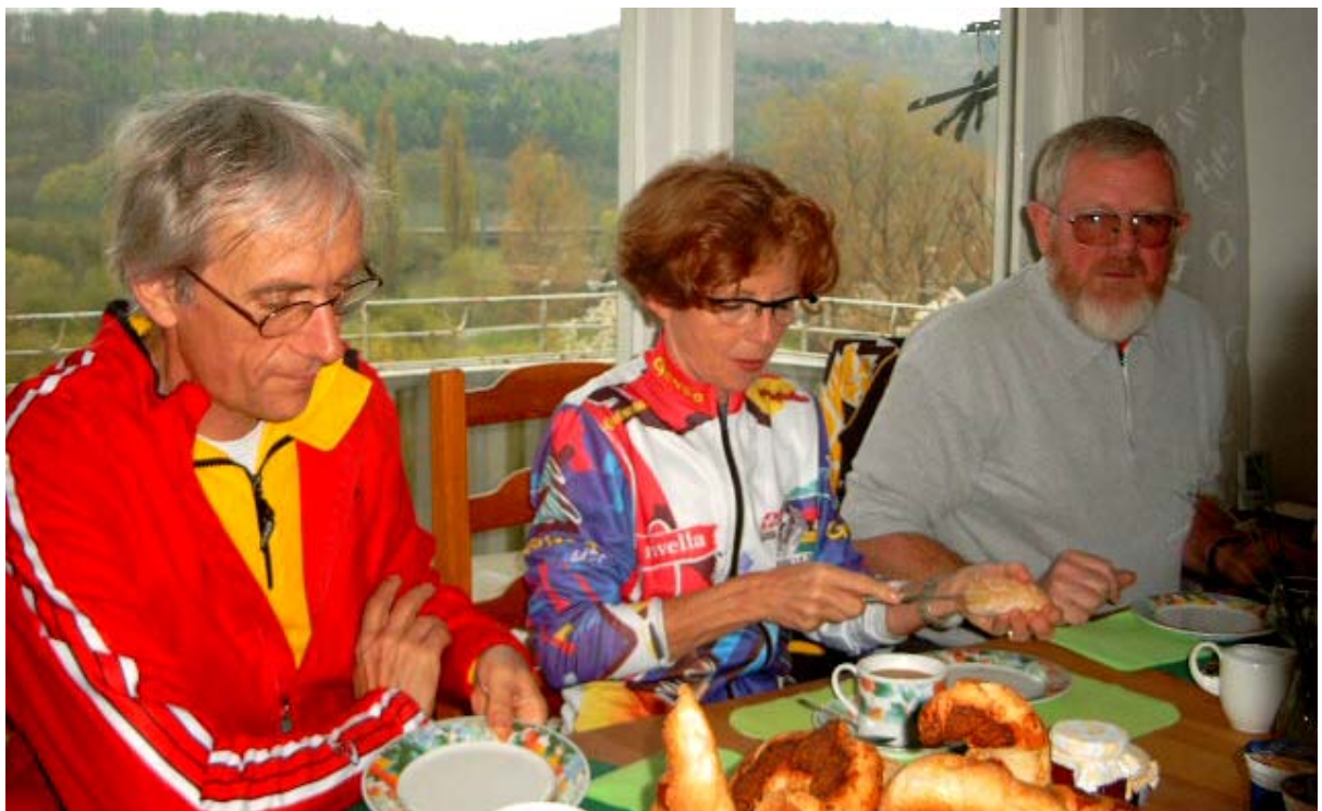
Ouverture mit Konfiture (und manch Leckerem mehr)