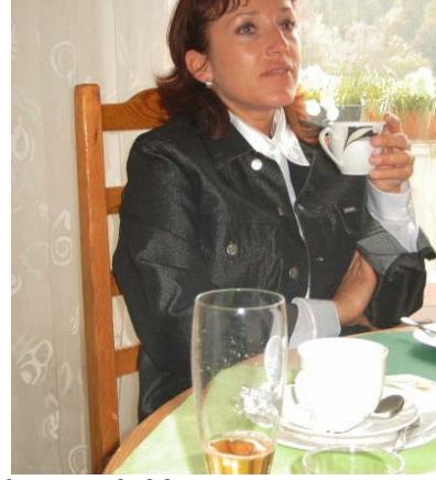
Auch das ist Prolog: Gespräche, Gedanken, Gefühle, Genüsse