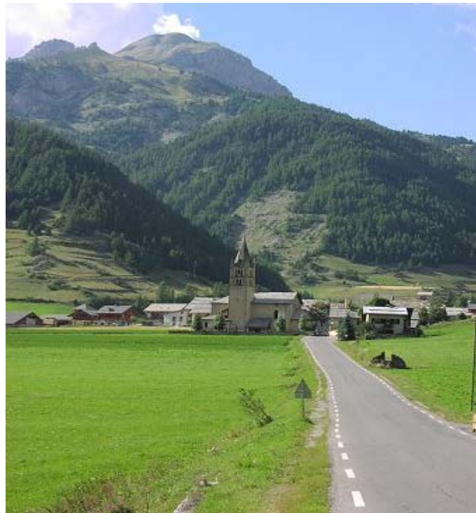
Rund 3 km und 150 Hm tiefer durchfährt man Anvieux.