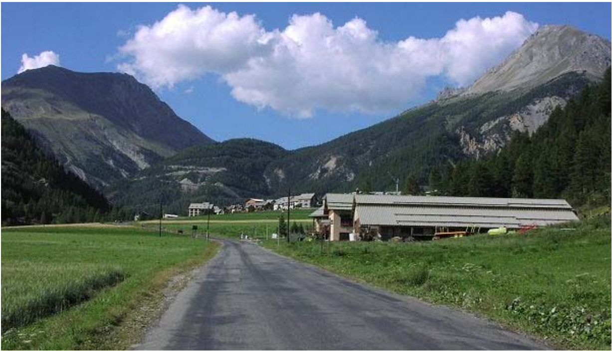
unterhalb Brunissard präsentieren sich die Serpentinaen fast komplett bis zur Casse Déserte.