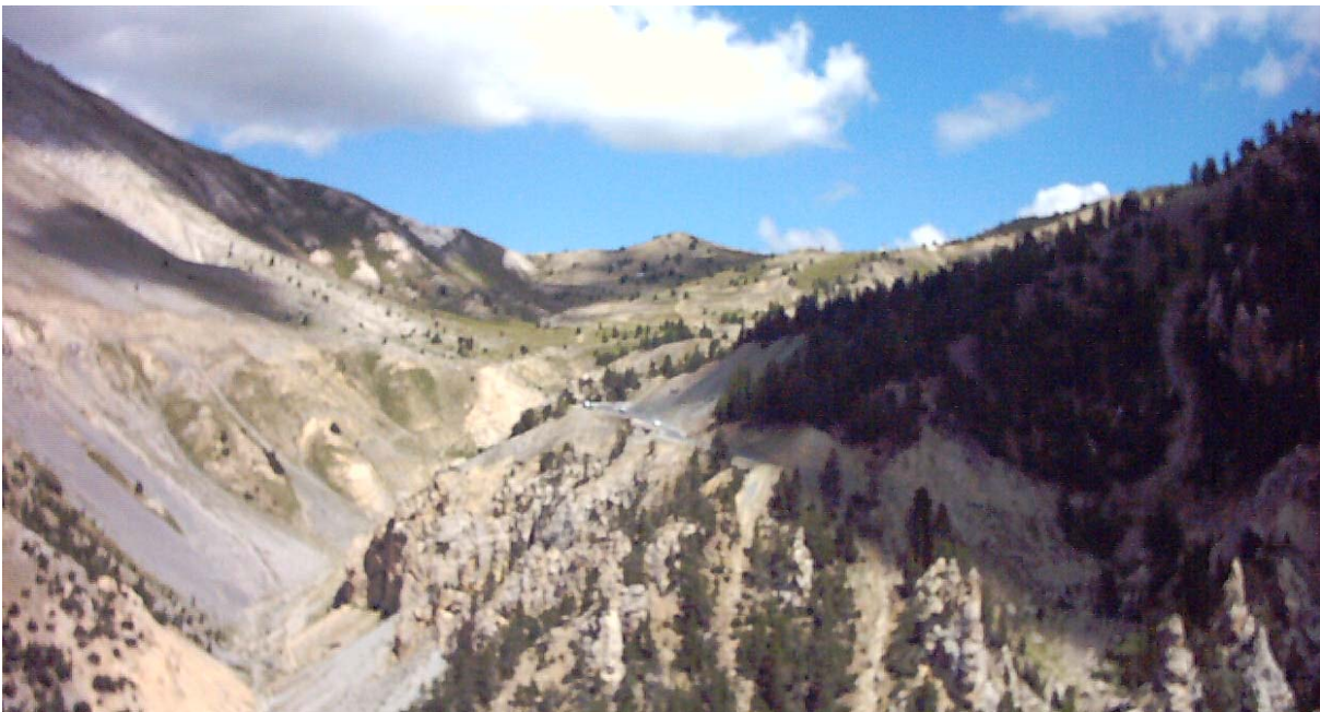
Retrospektive von der Gegenkuppe der Casse Déserte über die oberen Serpentinien des Südaufstiegs zur Passhöhe