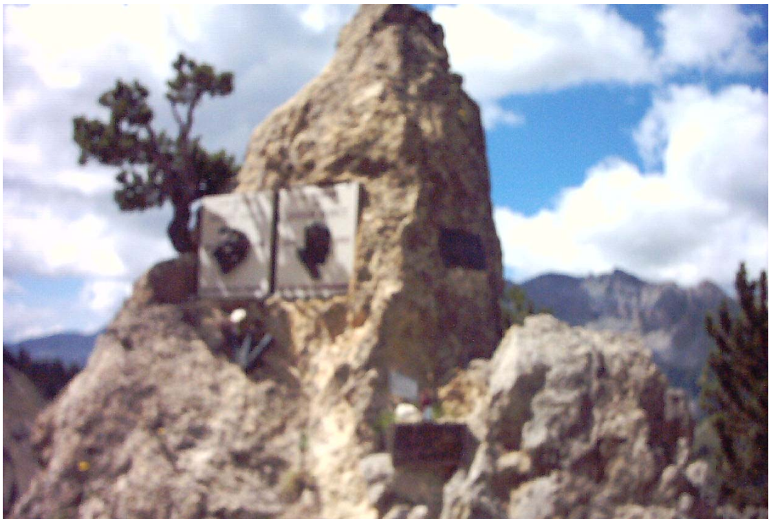
die Büsten von Fausto Coppi und Louison Bobet