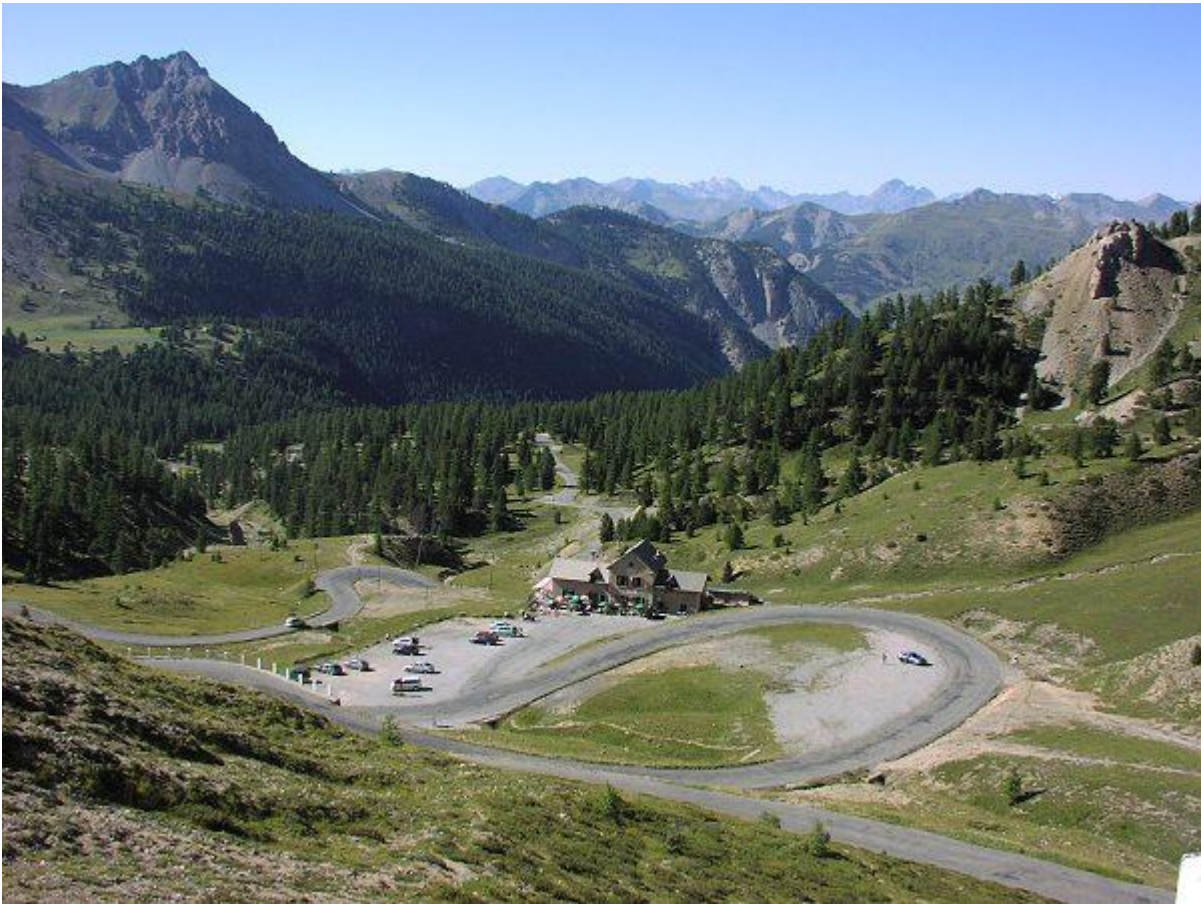
Col d'Izoard - 2360m Northern Ascent from Briançon