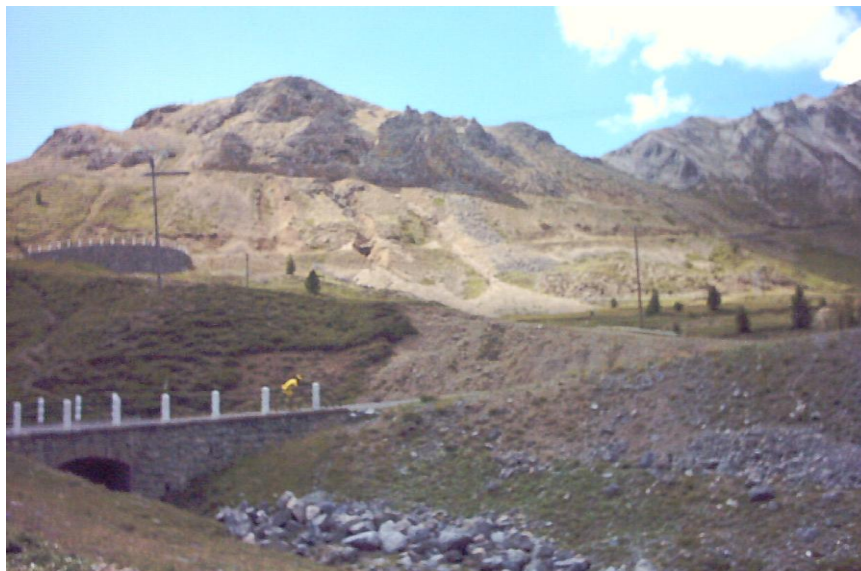
noch 2 km