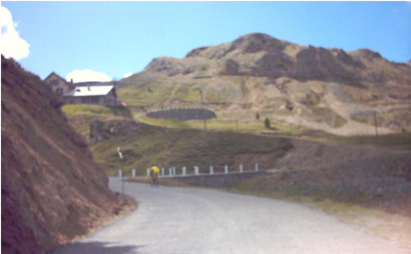
noch 3 km