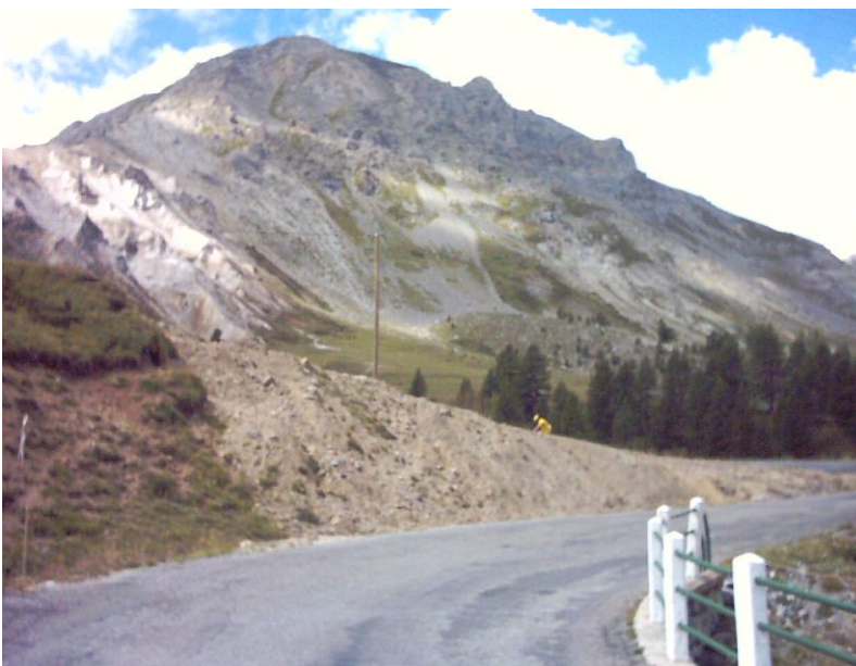
noch 1 km