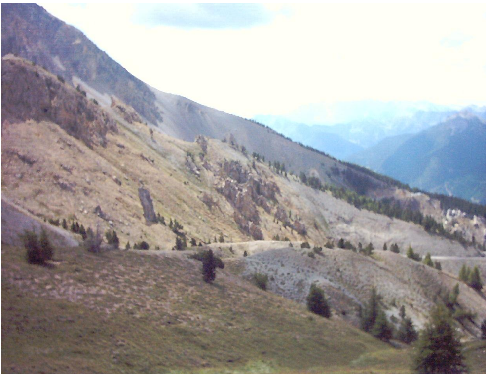
Blick vom Pass nach Süden in die Casse Déserte