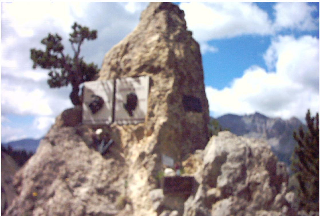
die Büsten der Tour-Ikonen Fausto Coppi und Louison Bobet